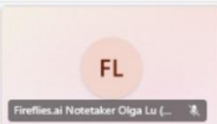
Fireflies.ai Notetaker Olga Lu (...)